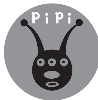
現在使用している 財団友の会のロゴマーク